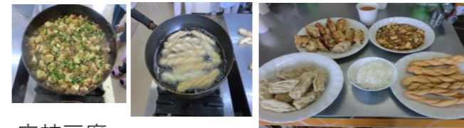
麻辣豆腐 麻花(揚げ物のお菓子) 餃子は焼きと水餃子の2種類

第2回目(9/28)10時～「アメリカンチリ・サラダ・スープ」の予定です。参加申込はコミセンまで