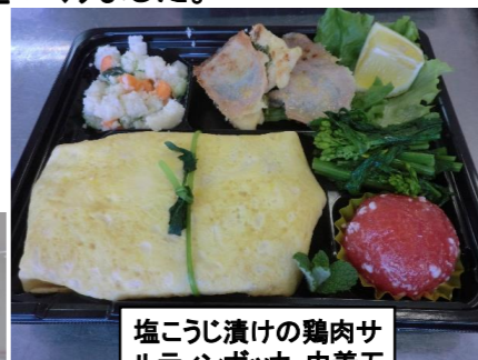
塩こうじ漬けの鶏肉サル テインポッカ・巾着五 目ちらし・おからのサラ ダなど